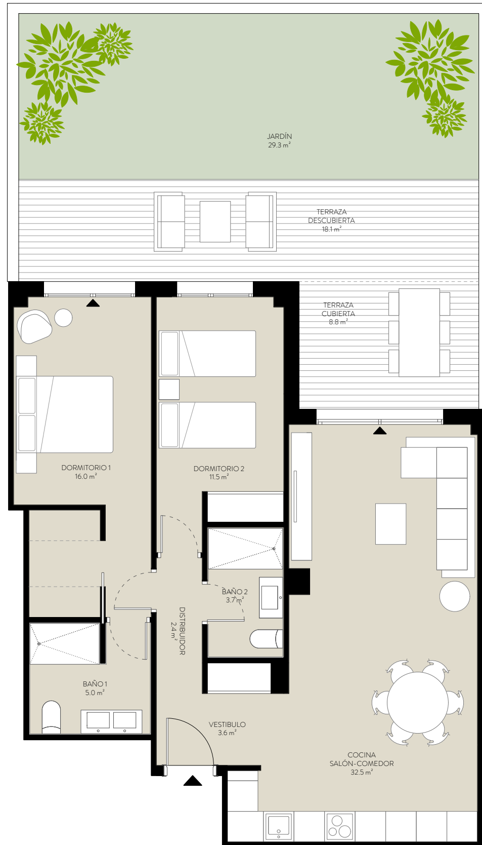
Vivienda PB G Tipo G.1